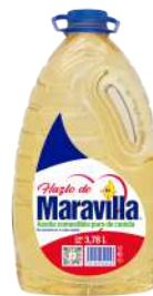
3.78 L Contenido Caja: 4 Botellas