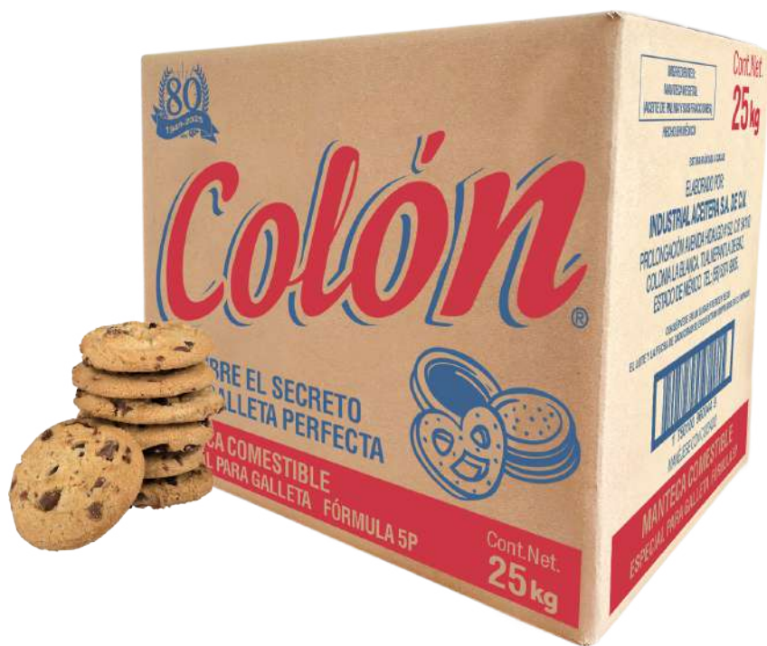
Colón Especial Galleta (5P) (Manteca vegetal comestible)

Colón Especial para GALLETA (5P) (Manteca vegetal comestible) También se puede utilizar en: -Alto freído -Repostería .Rellenos ( La mejor fórmula para la industria repostera, galletera, entre otros.