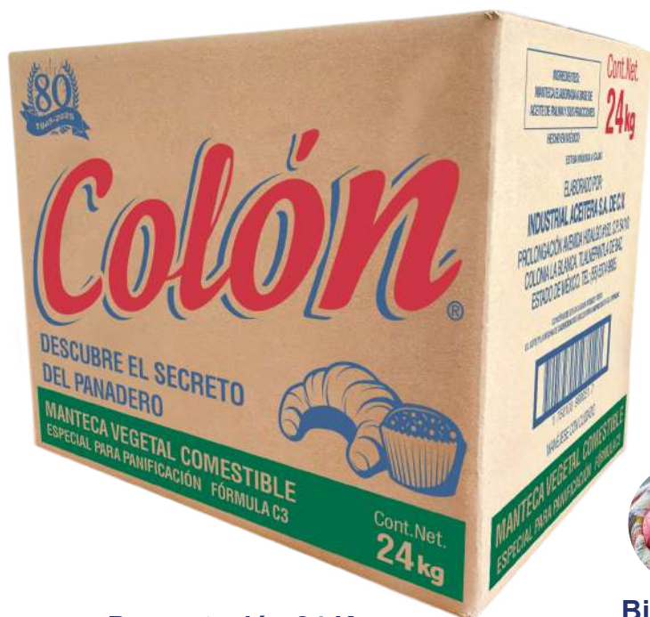
Presentación 24 Kg