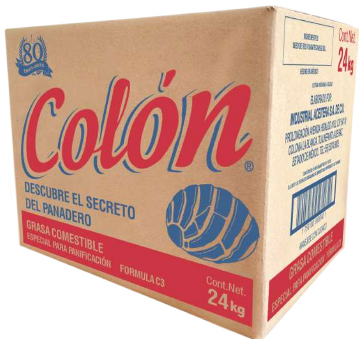
Presentación 24 Kg