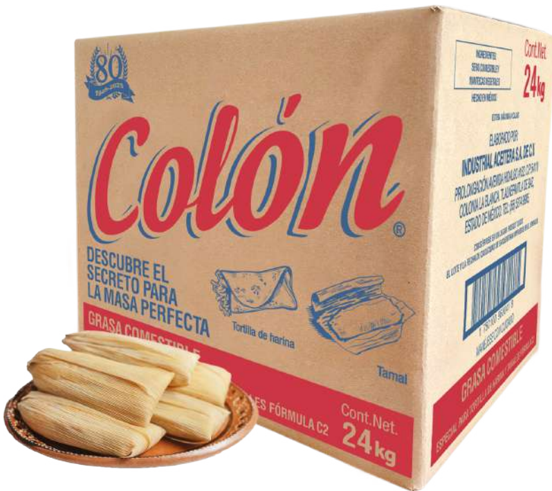
Colón Especial para Tortillas de Harina y Tamales (C2) (Grasa comestible)

Colón La Tamalera y Tortillerade Harina La mejor fórmula para la industria de tortillas de harina y tamales. Perfecta para cualquier tamaño de operación. Conserva el sabor, color y consistencia tradicional.