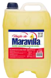
20 L Contenido Caja: 1 Bidón

Tradición de Maravilla ® Aceite vegetal comestible puro de canola