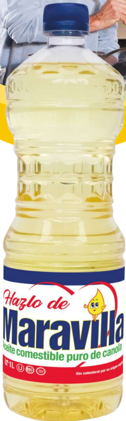
1 L Contenido Caja: 12 Botellas

Tradición de Maravilla ® Aceite vegetal comestible puro de canola