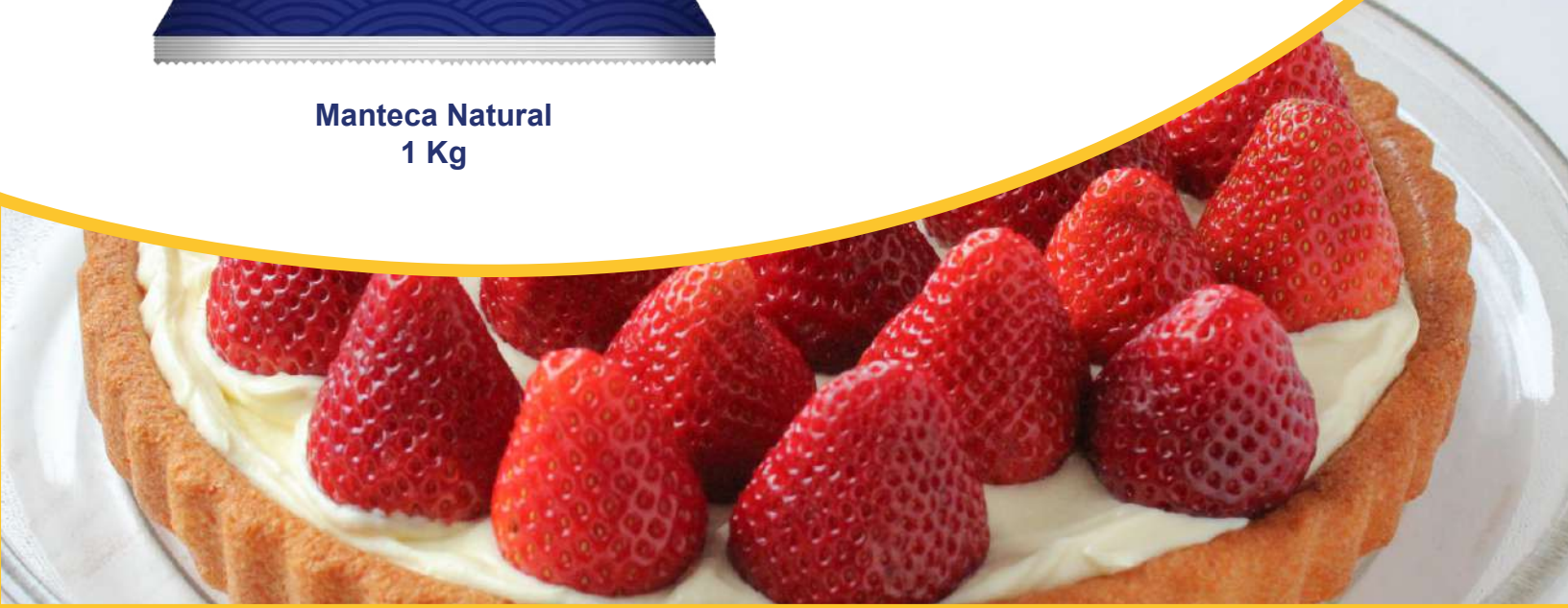
Manteca Natural 1 Kg